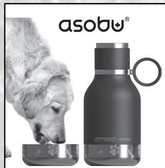
Asobu is a Montreal based company supplying IDF.