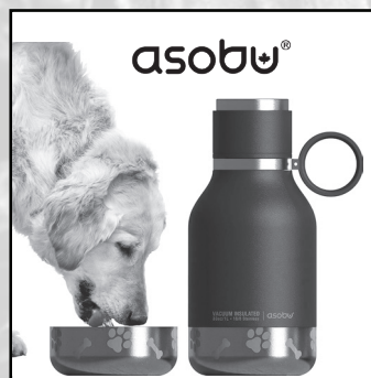
Asobu est une entreprise basée à Montréal qui fournit IDF.